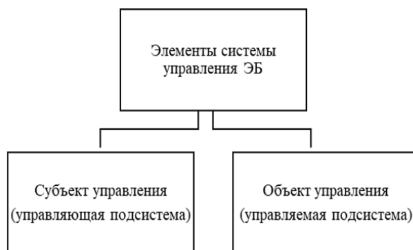
Рисунок 1. Элементы системы управления экономической безопасностью.

Под экономической безопасностью понимают состояние защищенности хозяйствующего субъекта, при котором организация защищена от внешних и внутренних угроз. Для грамотного управления экономической безопасностью создается система управления экономической безопасностью [5]. Управление подразумевает воздействие на управляемую систему с целью обеспечения требуемого её поведения или изменения её характеристик [3]. Элементы системы управления экономической безопасностью можно представить схематично (рисунок 1).