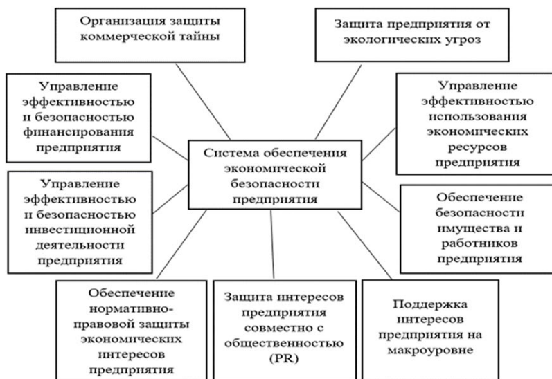
Рисунок 3. Система обеспечения экономической безопасности предприятия.

При определении уровня безопасности используются как количественные методы, так и качественные. Количественные методы основываются на расчете показателей, информация для которых содержится в отчетности. Качественные методы строятся на опыте и наблюдениях и дают менее точные результаты. Обобщающий результат – это итоговый уровень экономической безопасности, учитывающий состояние каждой составляющей. Данный уровень может быть установлен как высокий, средний, низкий и критический. В результате проведенной оценки должны осуществляться разработка и реализация мероприятий по повышению уровня ЭБ, то есть по устранению выявленных угроз и минимизации рисков.