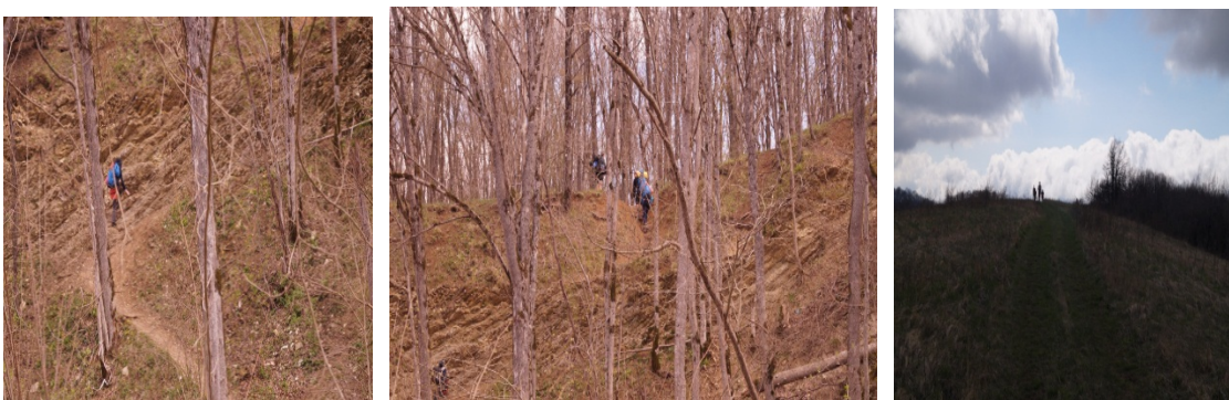
Рисунок 5. Подъём в гору.

Пост 6. Дорога пересекает большую, уже заросшую кустарником, поляну и поворачивает на юг. Обходить лесом очень трудно, так как и справа и слева лес густой. Дальше гребень почти горизонтальный. Подъём в гору, действительно, очень крутой и тяжёлый.