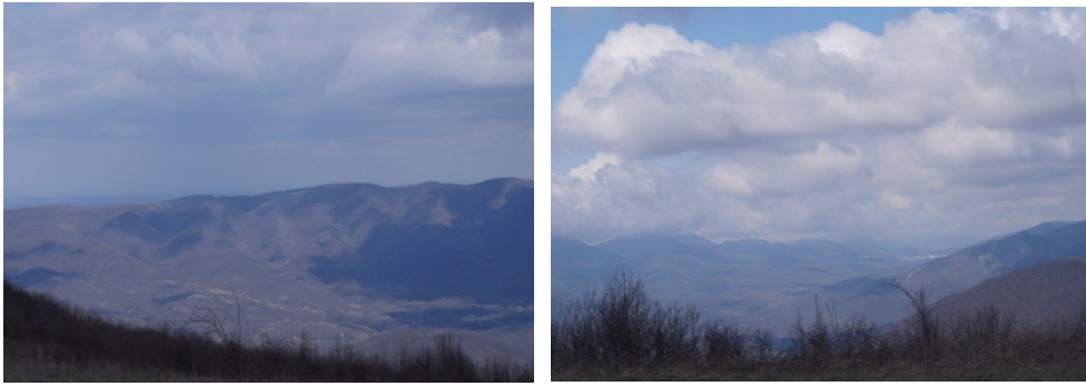
Рисунок 6. Вид с горы Лысяя

Отдохнув 12 часов, домой можно вернуться по уже пройденному пути, однако интереснее спуститься на перевал Бабича, повернуть направо и по реке Скобидо вернуться в Шапсугскую. Спуск к перевалу Бабича очень крутой, в самом начале дорога совершенно не просматривается в высокой густой траве и нужно придерживаться гребня, уходящего вниз. Но вскоре начинается лес, а там дорога по гребню уже четко видна, которая вскоре приведёт к реке.