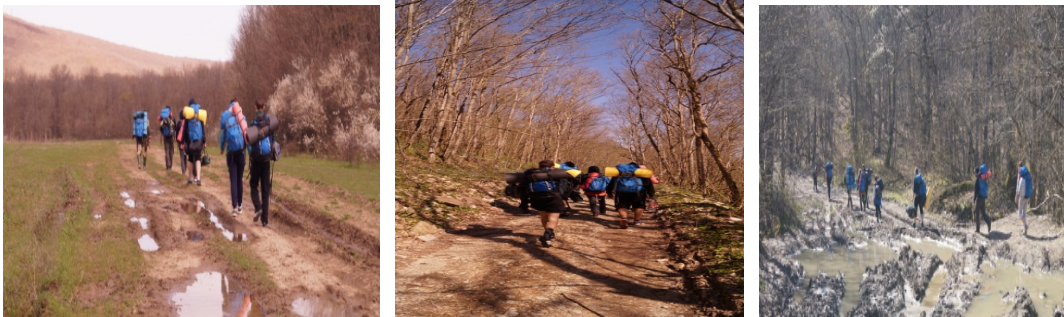
Рисунок 4. Грунтовые дороги.

Пост 5. Здесь когда-то была хорошая гравийная дорога с кюветами, но сейчас она заброшена и запущена. Дорога сворачивает вправо, входит в лес, крутизна подъёма нарастает.