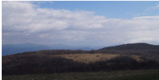
Рисунок 1. Гора Лысая.

Ниже представлена игра «Восхождение на гору Лысая»