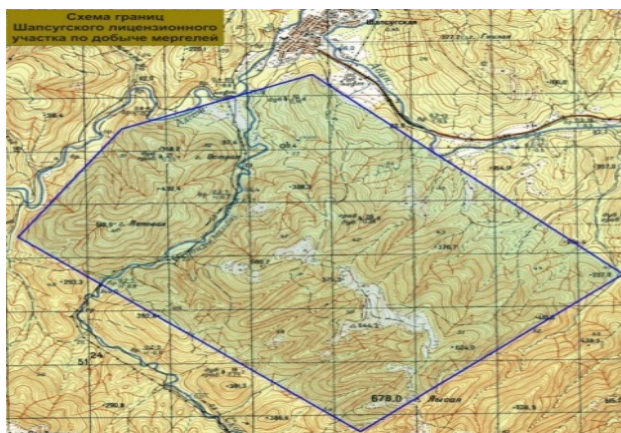
Рисунок 2. Топографическая карта.

Пост 4. Определить названия карт под рисунком «2» и «3»; в каком направлении на въезде в Шапсугскую со стороны Абинска находится хребет Коцехур (Лысые горы) и какова её вершина [2] (стоимость ответа -10 баллов).